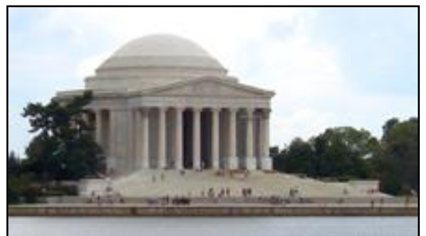
Το μνημείο του Τζέφερσον στην Ουάσιγκτον.