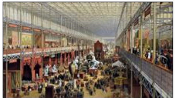
Το εσωτερικό του Κρυστάλλινου Παλατιού.

μέχρι υπόστεγα τρένων. Ένα πολύ γνωστό κτήριο από γυαλί και σίδηρο του 19ου αιώνα είναι το Κρυστάλλινο Παλάτι στο Χάιντ Παρκ του Λονδίνου, που χτίστηκε το 1851 για να στεγάσει τη Μεγάλη Έκθεση, με εμφάνιση παρόμοια με ένα θερμοκήπιο.