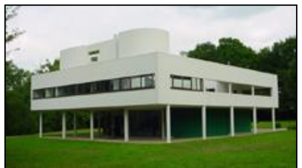
Βίλα σχεδιασμένη από τον Λε Κορμπιζιέ.

Το Διεθνές Στυλ εμφανίστηκε στην Ευρώπη μετά τον Α΄ Παγκόσμιο Πόλεμο, επηρεασμένο από πρόσφατα κινήματα της τέχνης, και είχε στενή σχέση με το Μπάουχαους. Σε αντίθεση με σχεδόν κάθε άλλο αρχιτεκτονικό στυλ που προηγήθηκε, το Διεθνές Στυλ εξάλειψε τα περιττά διακοσμητικά και χρησιμοποίησε σύγχρονα βιομηχανικά υλικά όπως χάλυβα, γυαλί, οπλισμένο σκυρόδεμα και επιχρωμίωση.