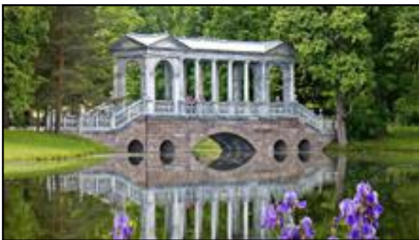
Η μαρμάρινη γέφυρα στη Ρωσία.