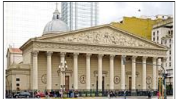
Ο Μητροπολιτικός Καθεδρικός στο Μπυένος Άιρες.