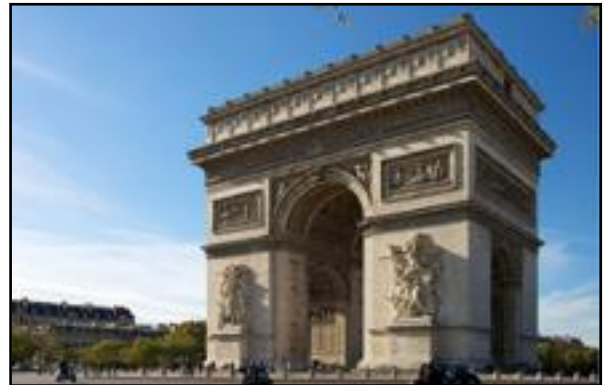
Η Αψίδα του Θριάμβου στο Παρίσι.