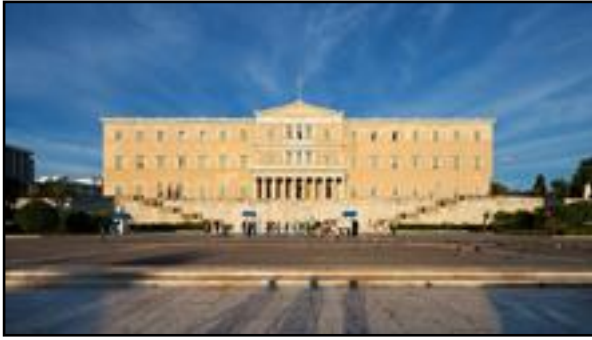
Τα Παλαιά Ανάκτορα – σήμερα η Βουλή των Ελλήνων.