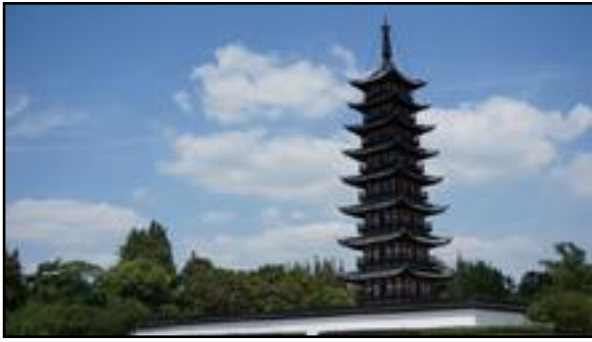
Παγόδα κτισμένη τον 11ο αιώνα.

Μικρό τμήμα από το Σινικό Τείχος της Κίνας, που χτίστηκε κατά τη διάρκεια της δυναστείας των Μινγκ (1368 ως 1644).