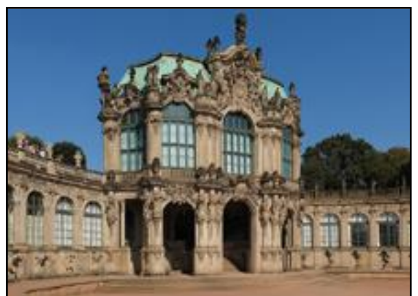
Παλάτι στη Δρέσδη.