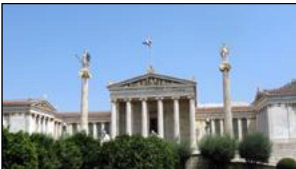
Η Ακαδημία της Αθήνας.