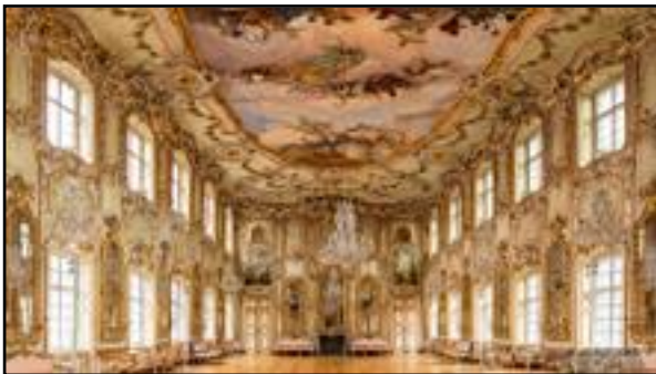
Η Φεστιβαλική αίθουσα στο Άουγκζμπουργκ.