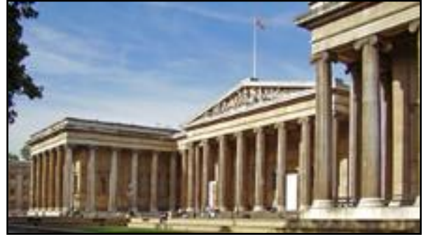
Το Βρετανικό Μουσείο στο Λονδίνο.