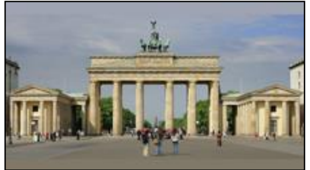
Η Πύλη του Βρανδεμβούργου στο Βερολίνο.

Το τέλος του ροκοκό τοποθετείται περίπου στη δεκαετία του 1760 όταν σταδιακά αντικαθίσταται ως κυρίαρχη καλλιτεχνική τάση από το ρεύμα του Νεοκλασικισμού . Η ανάπτυξη της αρχαιολογίας ήταν κρίσιμη για την ανάδειξη της αρχιτεκτονικής αυτής. Στην πιο βασική της μορφή έχει ένα ύφος προερχόμενο κυρίως από την αρχιτεκτονική της κλασικής Ελλάδας και της Ρώμης.