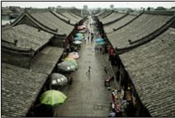
Μια σύγχρονη αγορά κατά μήκος ενός δρόμου.