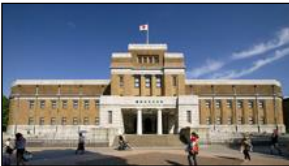
Το Εθνικό Μουσείο Επιστημών της Ιαπωνίας.