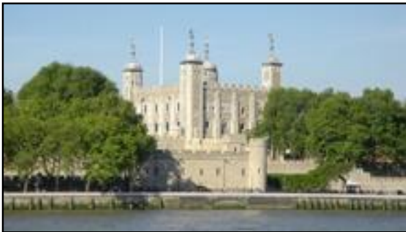
Ο πύργος του Λονδίνου (το 1100).

Το κάστρο των Νορμανδών στη Σικελία (12ος αιώνας).