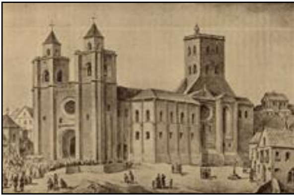
Αναπαράσταση του Καθεδρικού ναού της Λισαβώνας.