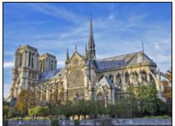
Η Παναγία των Παρισίων άρχισε να κατασκευάζεται το 1163.