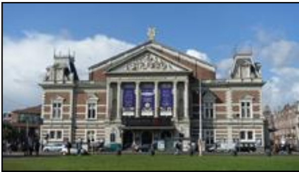
Το Μέγαρο της Μουσικής στο Άμστερνταμ.