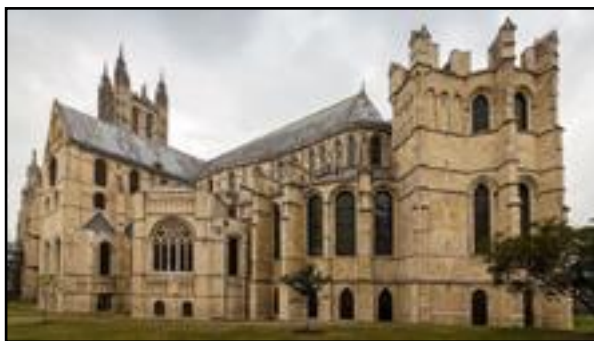
Ο Καθεδρικός ναός στο Καντέρμπουρι της Αγγλίας (το 1180) γοθτικού ρυθμού.