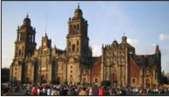
Ο Μητροπολιτικός Καθεδρικός ναός στην πόλη του Μεξικού.

Ο όρος Ροκοκό αναφέρεται στην τεχνοτροπία που διαδέχθηκε το μπαρόκ και αναπτύχθηκε στις αρχές του 18ου αιώνα, κυρίως στη Γαλλία. Ως καλλιτεχνικό ρεύμα, εκδηλώθηκε κατά κύριο λόγο στη ζωγραφική, τη διακόσμηση και την αρχιτεκτονική.