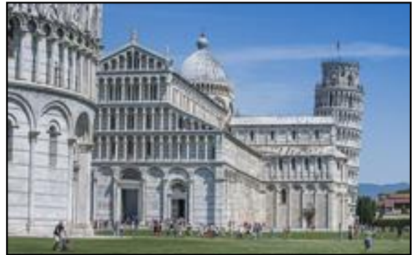
Ο Καθεδρικός ναός και στο βάθος ο κεκλιμένος πύργος της Πίζα.