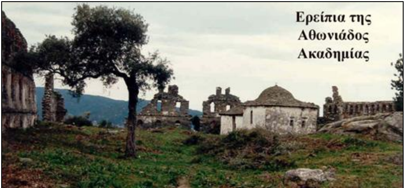
Ερείπια της Αθωνιάδος Ακαδημίας

της Ακαδημίας ήταν ο Ευγένιος Βούλγαρης. Η Ακαδημία σύντομα απέκτησε ιδιαίτερη φήμη και προσέλκυσε μεγάλο αριθμό σπουδαστών. Το 1821 διέκοψε τη λειτουργία της.