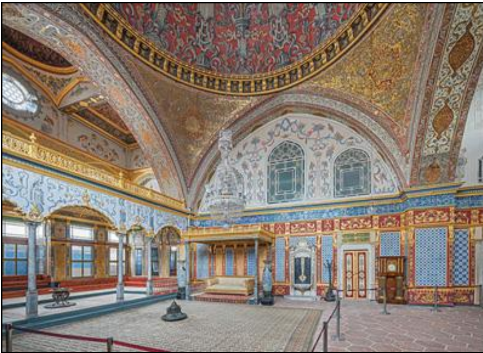
Ο θρόνος του Σουλτάνου

Το κατακτημένο έδαφος μοιράστηκε σε Οθωμανούς ευγενείς, οι οποίοι το διατηρούσαν ως φέουδο υπό την εξουσία του σουλτάνου. Αυτή η γη δεν μπορούσε να πουληθεί ή να κληρονομηθεί, αλλά επανερχόταν στην κατοχή του σουλτάνου, όταν πέθαινε ο φεουδάρχης. Οι Οθωμανοί βασικά εγκατέστησαν αυτό το φεουδαρχικό σύστημα πάνω στο υπάρχον σύστημα. Οι αγρότες διατήρησαν τη δική τους γη και η κυριαρχία τους πάνω στη γη τους παρέμεινε κληρονομική και αναπαλλοτρίωτη. Δεν επιβλήθηκε στρατιωτική θητεία για τον αγρότη στην οθωμανική διοίκηση.