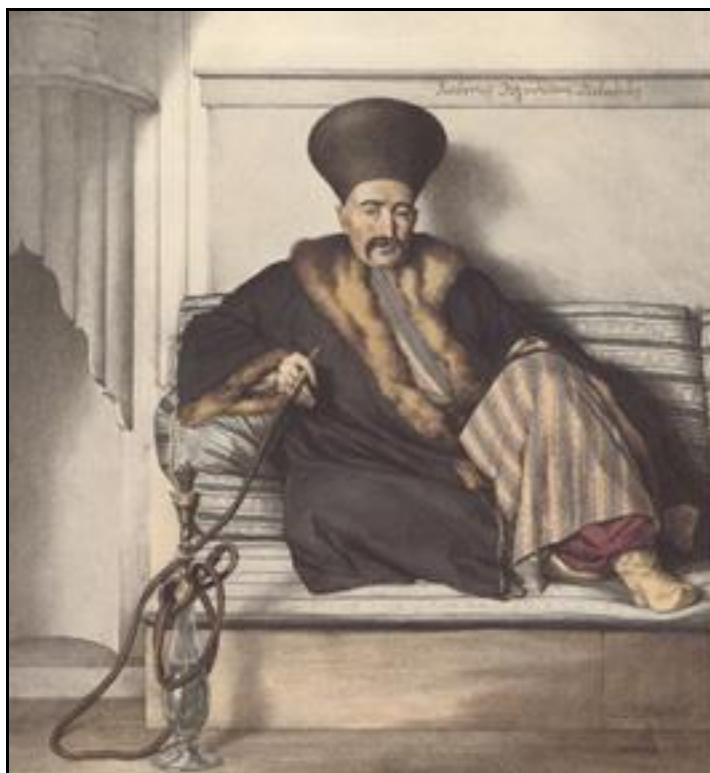
Ο Ιωάννης Λογοθέτης πρόκριτος της Λιβαδειάς

Η οικονομική κατάσταση της Ελλάδας υποβαθμίστηκε κατά τη διάρκεια της Οθωμανικής περιόδου της χώρας. Η ζωή έγινε σε μεγάλο βαθμό αγροτική και εφαρμόστηκε βαριά φορολογία στον χριστιανικό πληθυσμό. Πολλοί Έλληνες αναγκάστηκαν να στραφούν σε καλλιέργειες ή στο ψάρεμα, ώστε να εξασφαλίσουν την αυτάρκειά τους σε τροφή, ενώ σε προηγούμενες εποχές η ελληνική επικράτεια ήταν καλά αναπτυγμένη και αστικοποιημένη. Εξάιρεση σε αυτόν τον κανόνα ήταν η Κωνσταντινούπολη όπου ζούσαν πολλοί εύποροι Έλληνες.