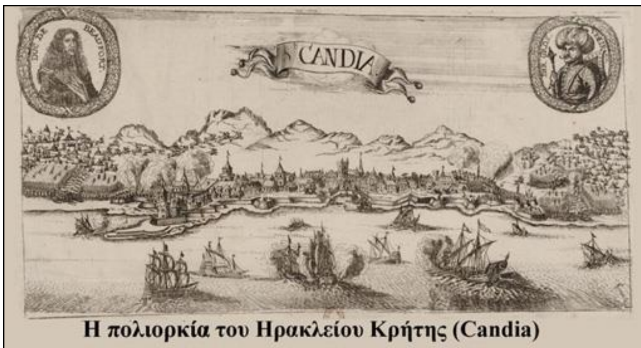
Η πολιορκία του Ηρακλείου Κρήτης (Candia)

Το 1579 ολοκληρώνεται η τυπική κατάκτηση των Κυκλάδων. Η Κύπρος έπεσε στα χέρια των Οθωμανών το 1571. Και η Κρήτη, που ήταν υπό τον έλεγχο των Βενετών, κατακτήθηκε το 1669 από τους Οθωμανούς μετά από 21 χρόνια πολιορκίας του Ηρακλείου. Οι Οθωμανοί προσπάθησαν να κατακτήσουν και τα Επτάνησα, αλλά τους απέκρουσαν οι Βενετοί.