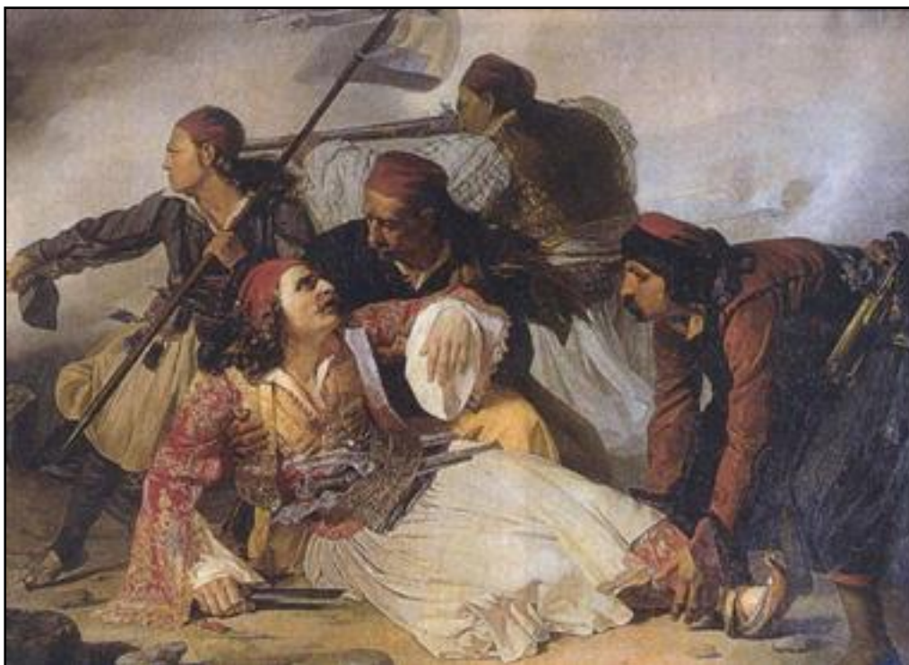
Ο θάνατος του Μάρκου Μπότσαρη (πίνακας του Lipparini)

Συνεισέφεραν στην Ελληνική Επανάσταση του 1821 με ηγέτες όπως τον Μάρκο Μπότσαρη και τον Κίτσο Τζαβέλλα.