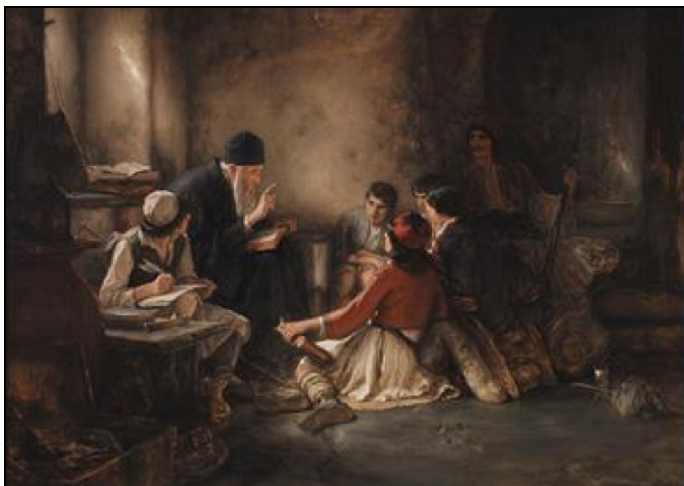
Το κρυφό σχολειό (του Ν. Γύζη)

κοινωνικής προέλευσης. Ζητούσαν τα παιδιά τους να διδάσκονται άλλα πιο ολοκληρωμένα μαθήματα από εκείνα που διδάσκονταν τα παιδιά των κοινών σχολείων.