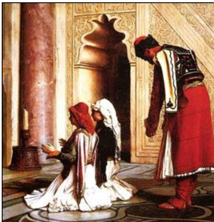
Η “προσφορά παιδιών” το “παιδομάζωμα”

Η φορολογία της οθωμανικής διοίκησης ήταν βαριά, περιλαμβάνοντας και «προσφορά παιδιών». Οι Οθωμανοί απαιτούσαν ένα αρσενικό παιδί στα πέντε σε κάθε χριστιανική οικογένεια να οδηγείται μακριά από την οικογένεια στο σώμα των Γενιτσάρων για στρατιωτική εκπαίδευση στον στρατό του σουλτάνου.